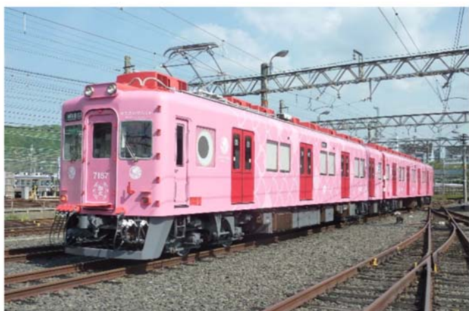
めでたいでんしゃに乗って加太の夏を満喫