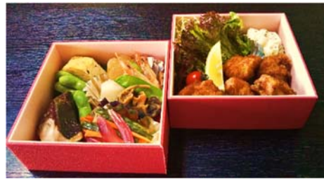
「のみたいでんしゃ」特製おつまみ