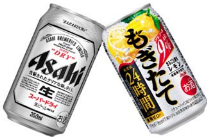
アサヒスーパードライ&もぎたて新鮮レモン