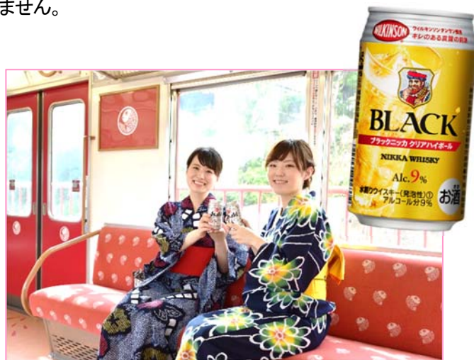
浴衣でお越しのお客さまにはハイボールをプレゼント！